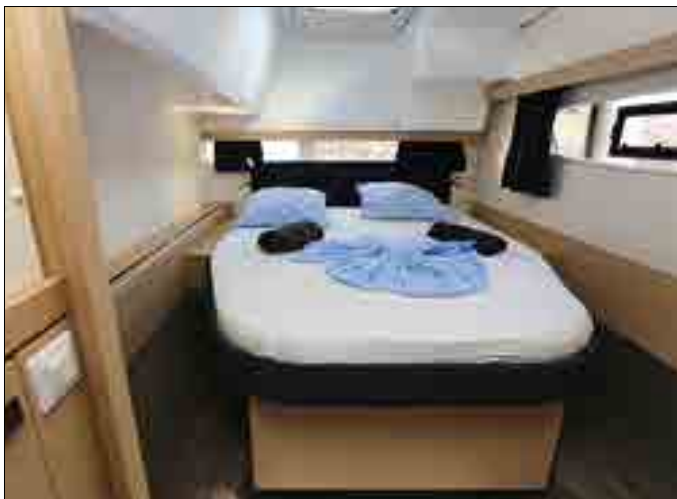
La très belle cabine arrière et son lit double accessible des deux côtés est malheureusement un peu juste en termes de rangements.

7. La table du cockpit est grande; elle mesure 1,70 m de long sur 0,85 m de large.