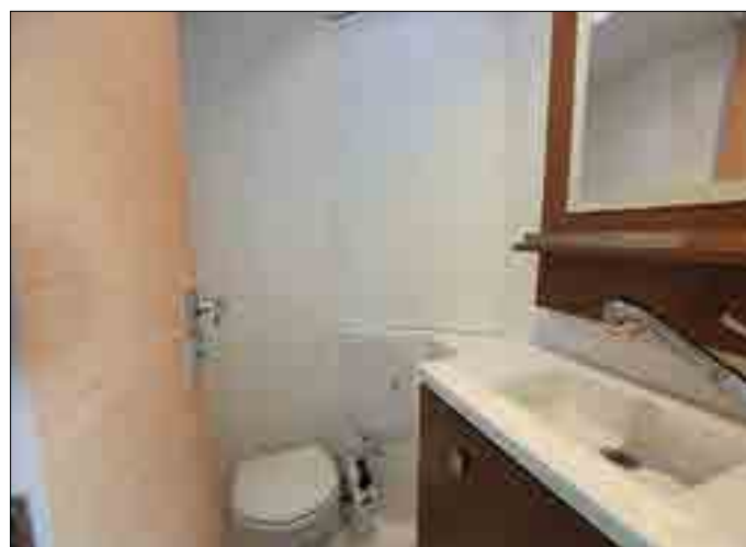
Le cabinet de toilette offre un accès depuis la cabine arrière. Les trousseaux de toilette se rangent dans un placard situé sous le lavabo.