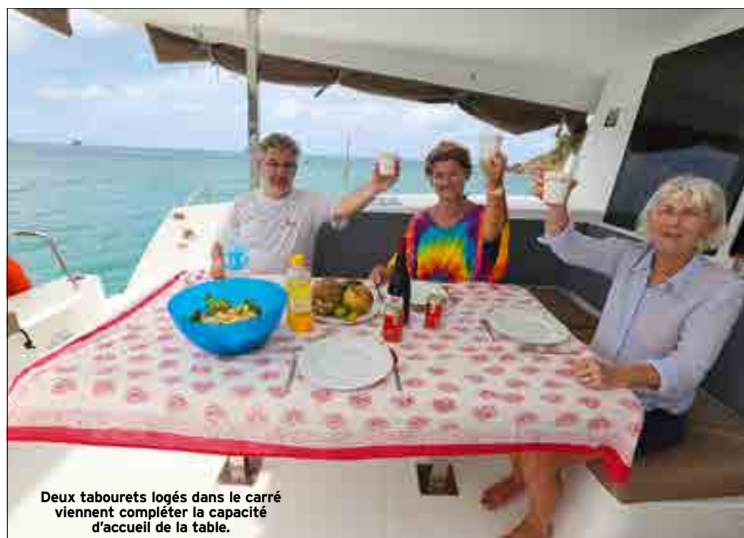
Deux tabourets logés dans le carré viennent compléter la capacité d'accueil de la table.