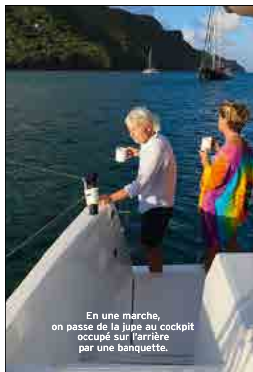
En une marche, on passe de la jupe au cockpit occupé sur l'arrière par une banquette.