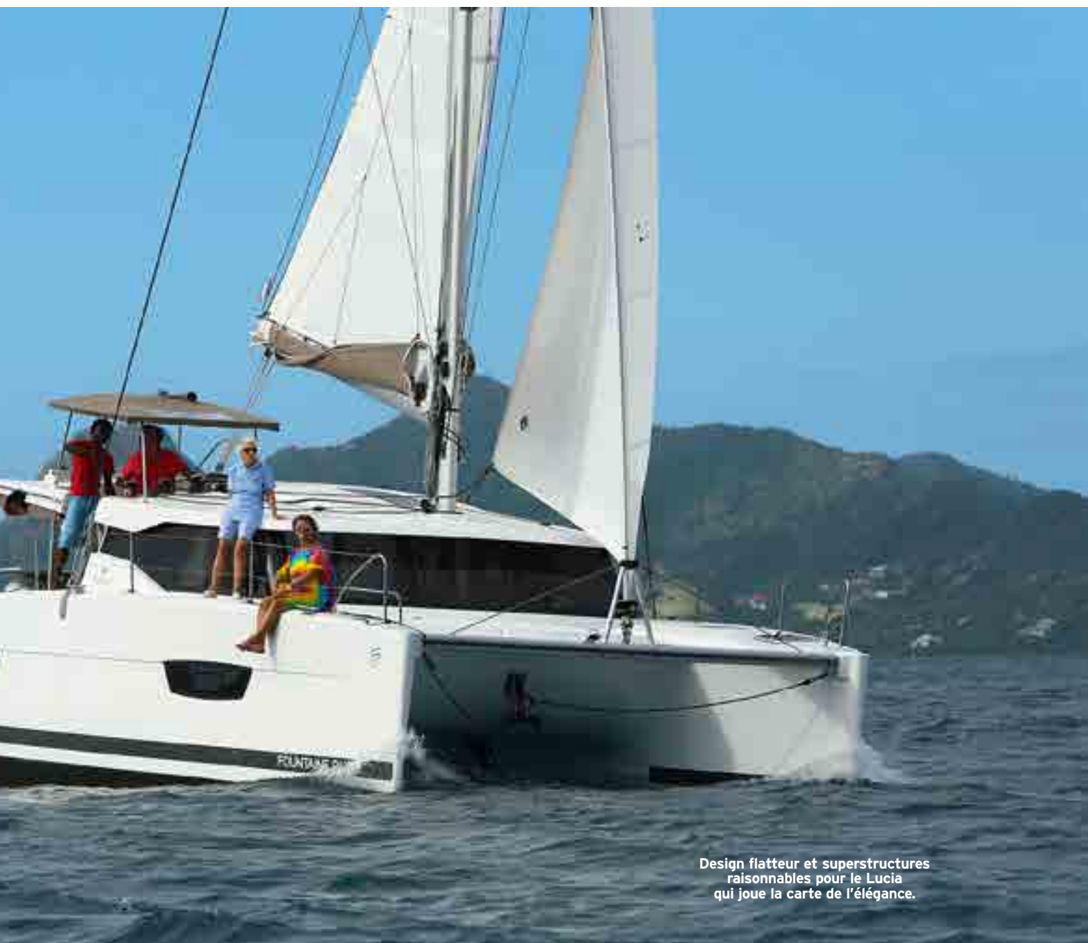
Design flatteur et superstructures raisonnables pour le Lucia qui joue la carte de l'élégance.